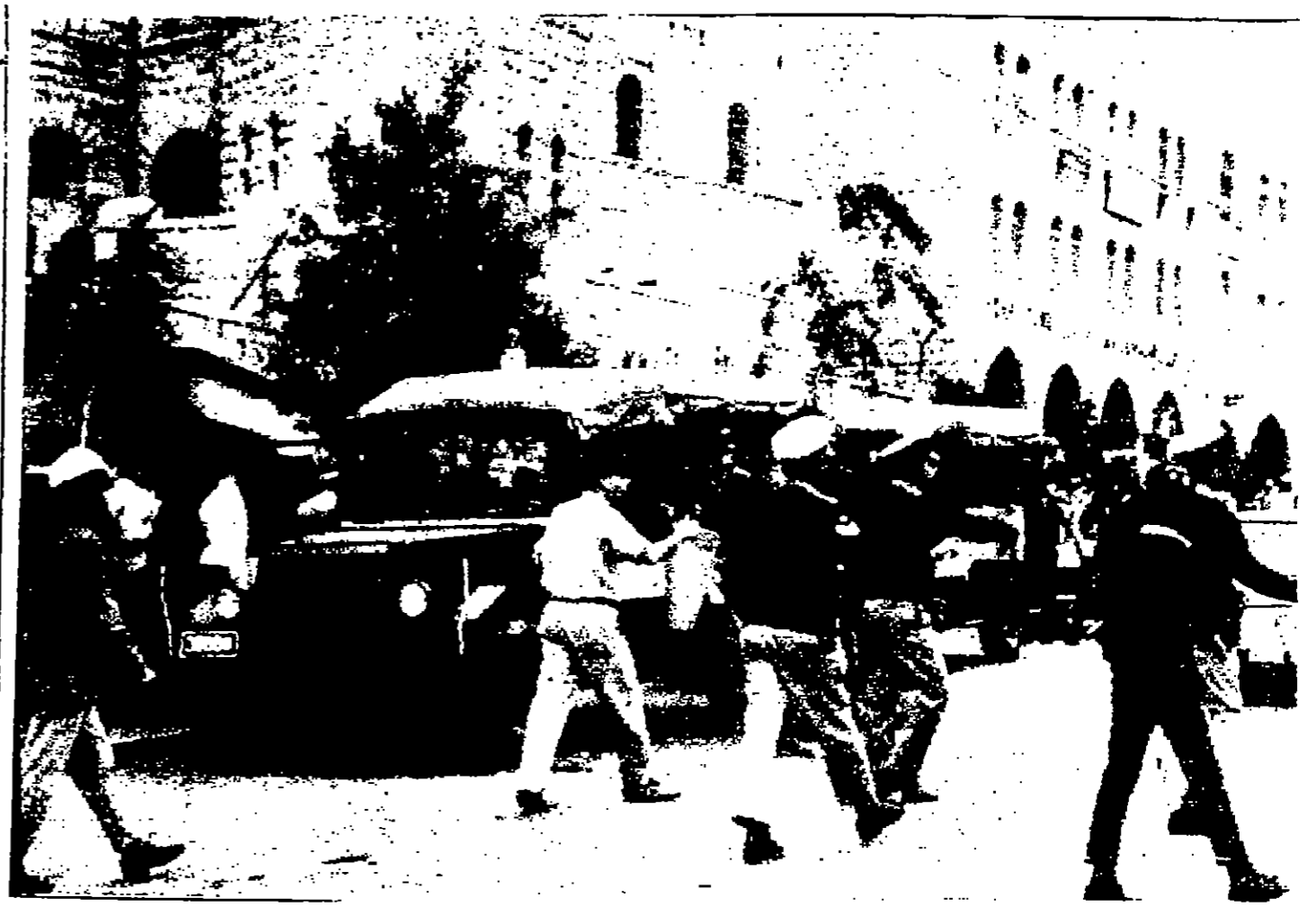
قوات الاحتلال الاسرائيلي في باب العمود بالتفصيل تنسحب الى سياراب الشرطة عندا من المتظاهرين العرب عند استمرار الاحتلال للجنة العربية القومية. خلف الصورة مكتب البنك العربي ومخبره شبيبة للثبات (صورة تذكيرية خلسة بالسفور من اليونانيس)